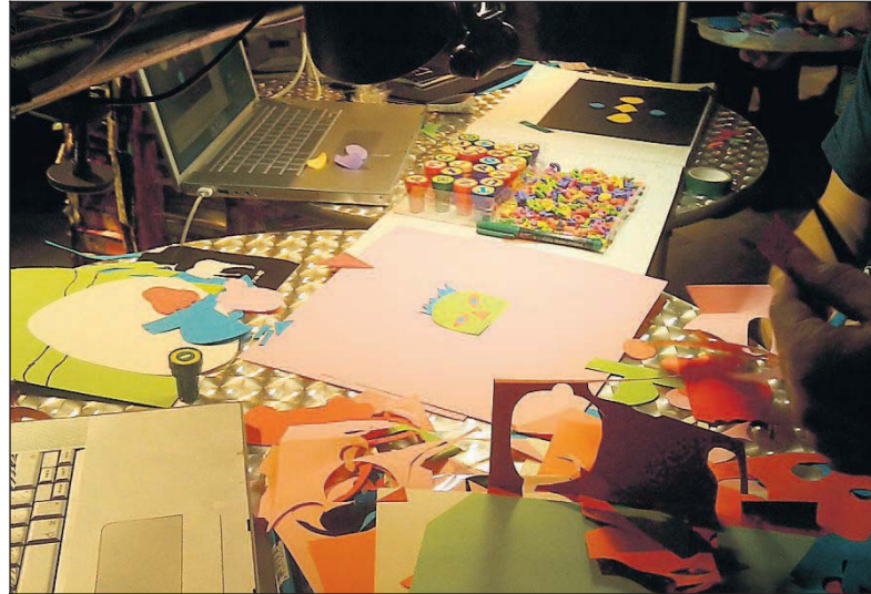
Videokunstenaars en muzikanten werken samen in het project 'Sound = vision'.